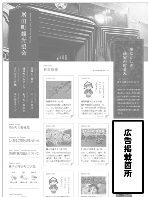
【掲載箇所はトップページ・右】

注目度の高い当ホームページに御社の魅力を最大限にPRできる機会です。ぜひ、ご検討ください。